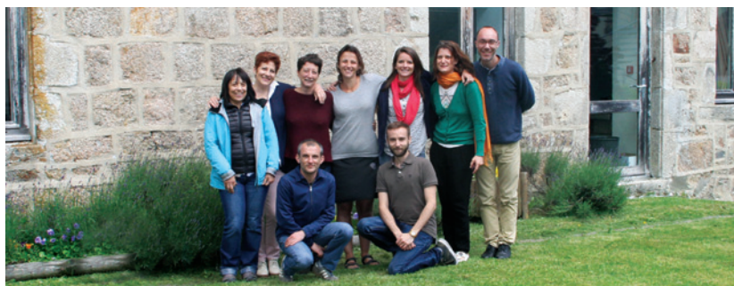
La nouvelle équipe technique de RESACOOOP Auvergne-Rhône-Alpes

Depuis juillet dernier, RESACOOOP est devenu le réseau Auvergne-Rhône-Alpes d'appui à la coopération internationale étendant ainsi ses services à l'ensemble du territoire de la grande région et reprenant les activités de l'association CERAPCOOP*. RESACOOOP dispose désormais de deux sites (Lyon et Clermont-Ferrand) et d'une équipe technique renforcée. ■