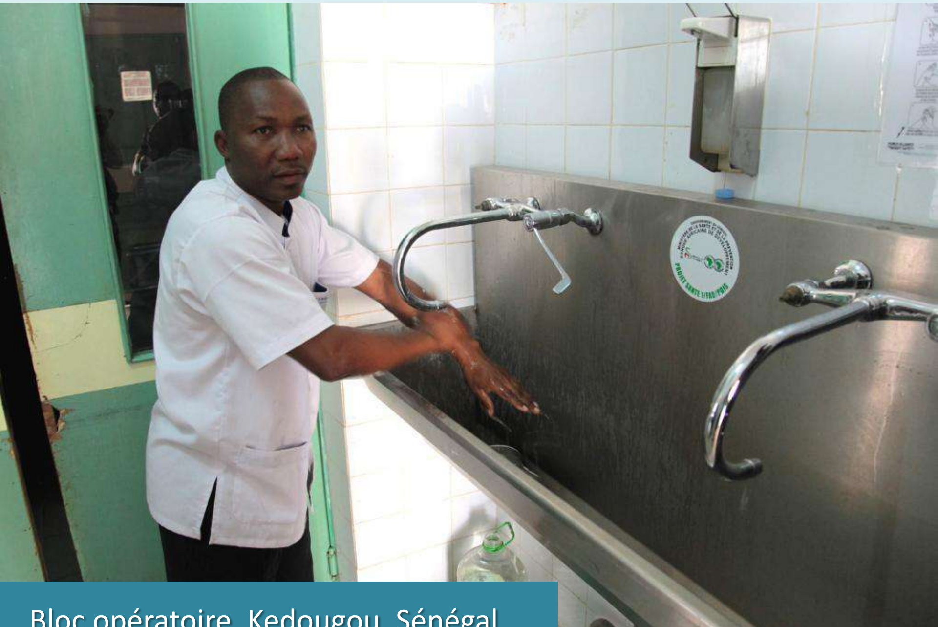
Bloc opératoire, Kedougou, Sénégal