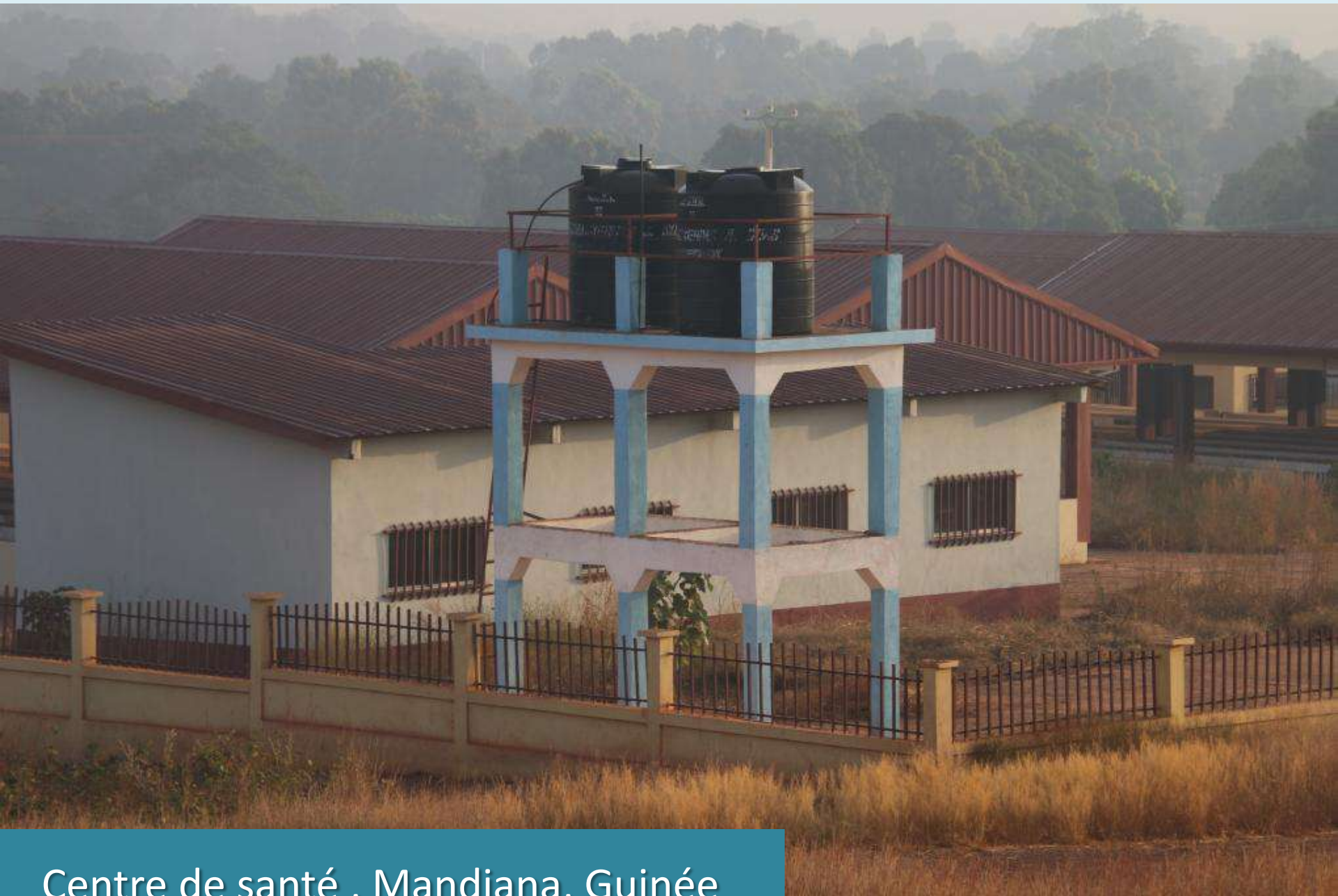
Centre de santé , Mandiana, Guinée